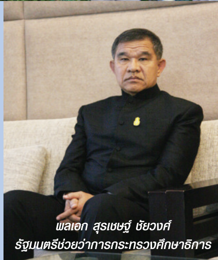
พลเอก สุรเชษฐ์ ชัยวงศ์ รัฐมนตรีช่วยว่าการกระทรวงศึกษาธิการ

"ไม่รู้ว่าจะใครมาจากไหน" มากำหนดนโยบายในการจัดกิจกรรมการเรียนการสอนวิชาประวัติศาสตร์ชาติไทย โดยพร้อมเพรียงกันทั่วประเทศ ในวันที่ 12 สิงหาคม 2560 เป็นต้นไป เพื่อเฉลิมพระเกียรติและสนองตามพระราชดำริที่ทรงตรัสไว้ เนื่องจากทรงห่วงใยการเรียนการสอนประวัติศาสตร์ชาติไทยที่ได้เลือนหายไปจากหลักสูตรการศึกษาไทยและมิผลทำให้เยาวชนในรุ่นหลังขาดความรู้เกี่ยวกับความเป็นมาของชาติไทย